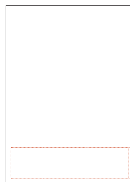
FJÄRDEDELSSIDA 1 500:- 180x70 mm